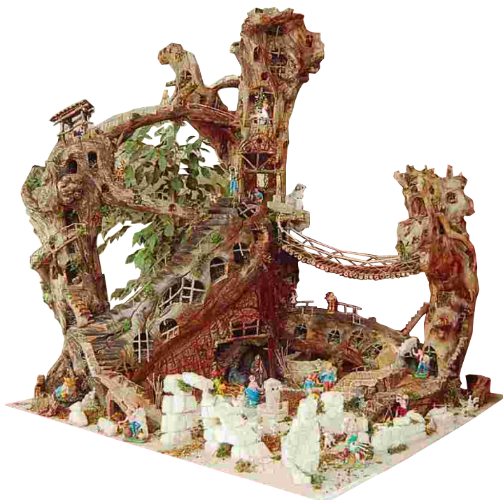
“PRESEPI VENUTI DAL MARE”