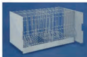
ART: 448 GABBIA da cm. 60x31x35 con 4 mangiatoie e 4 porte