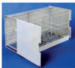
ART: 450-01 GABBIA da cm. 60x31x35 con 4 mangiatoie e parete posteriore in lamiera