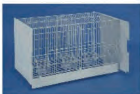
ART: 447 GABBIA da cm. 60x31x35 con 4 mangiatoie e 2 porte

con laterali lamiera estraibili frontalmente, disponibile nella versione su CARRELLO o A MURO, composta da 12 o 16 gabbie art.447, 448 o 450-01 ZINCATE oppure ZINCATE+VERN.C.BIANCO